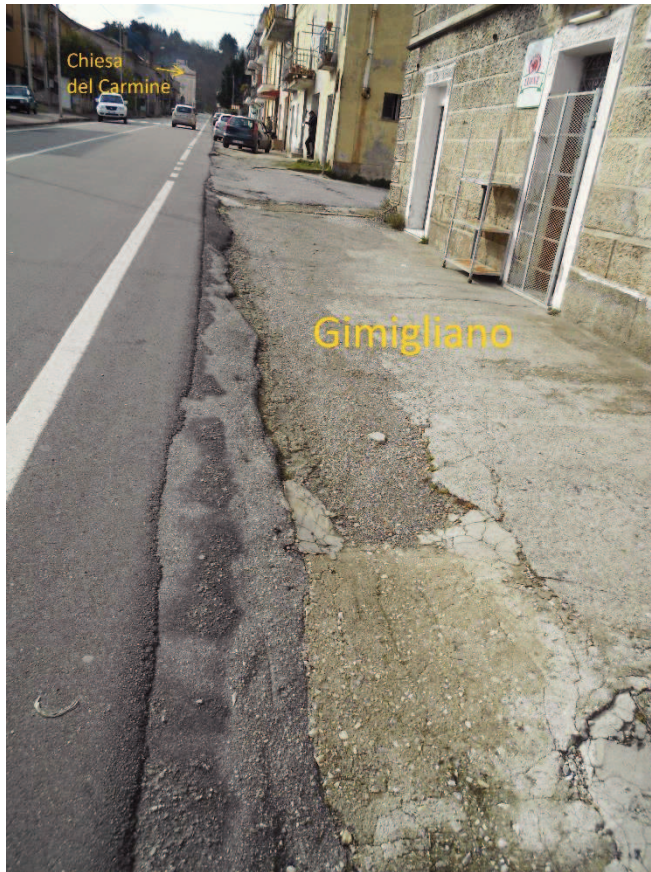
Figura 6 - Corso Vittorio Emanuele II, lato Gimigliano senza marciapiede