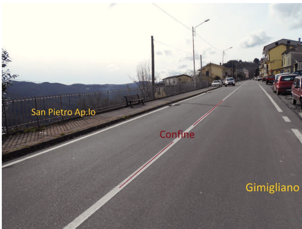
Figura 3 – Corso Vittorio Emanuele II, lato San Pietro Apostolo, con arredi urbani