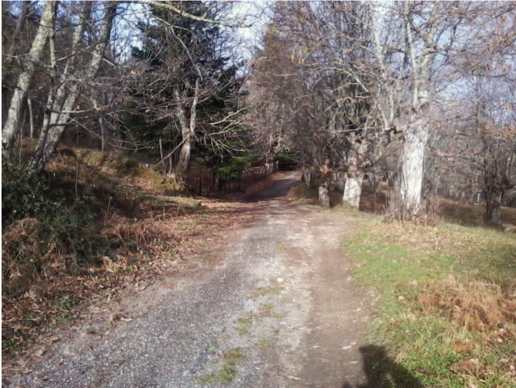
Figura 19 – Strada interpoderaie delle Manche