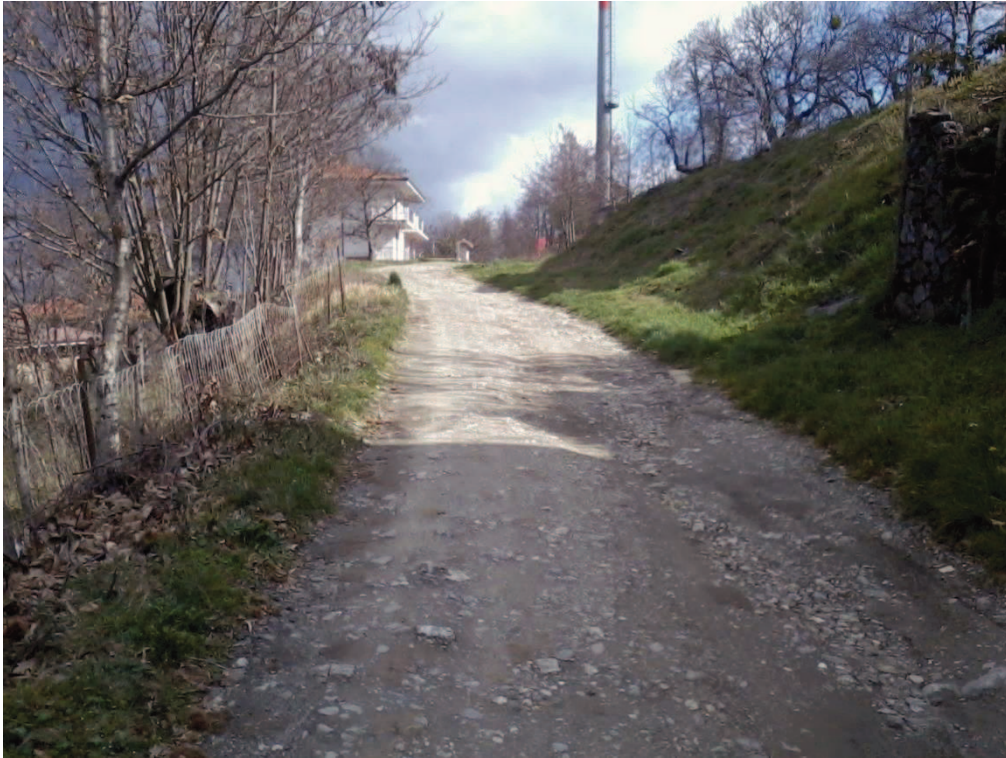
Figura 15 – Lottizzazione di contrada Colla, strada interna tra i lotti