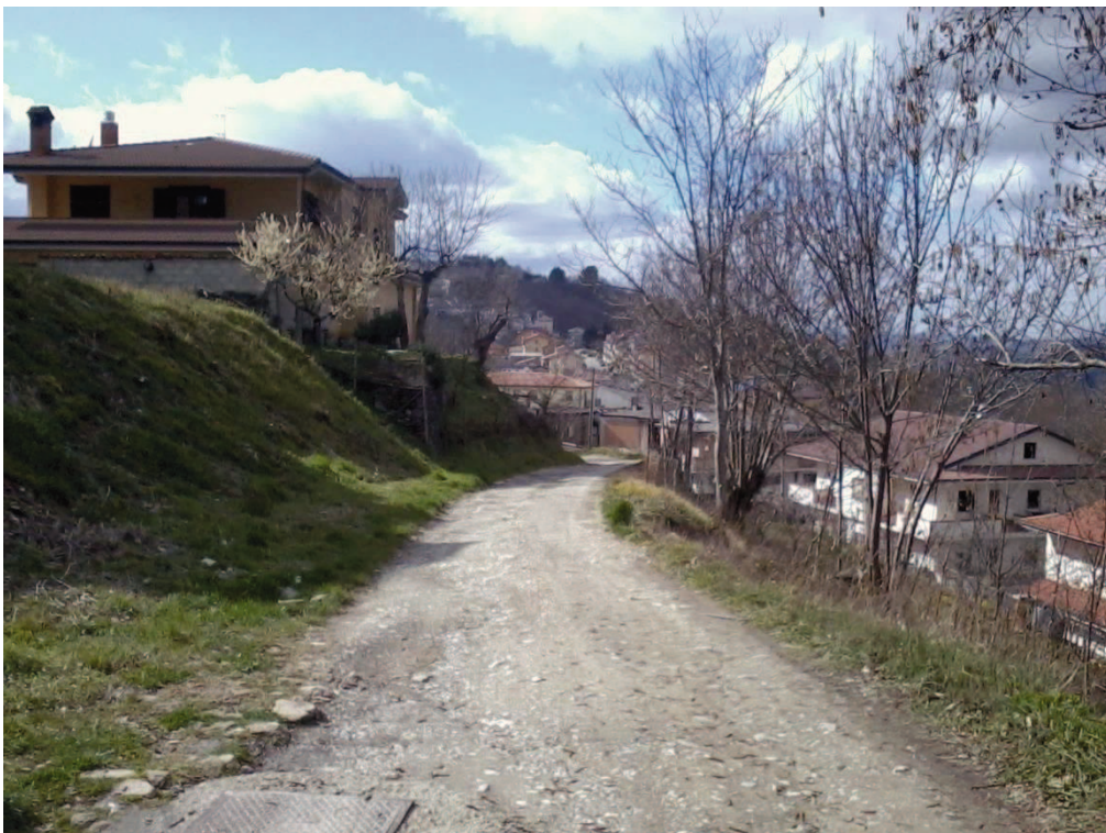
Figura 16 – Lottizzazione di contrada Colla, strada interna tra i lotti