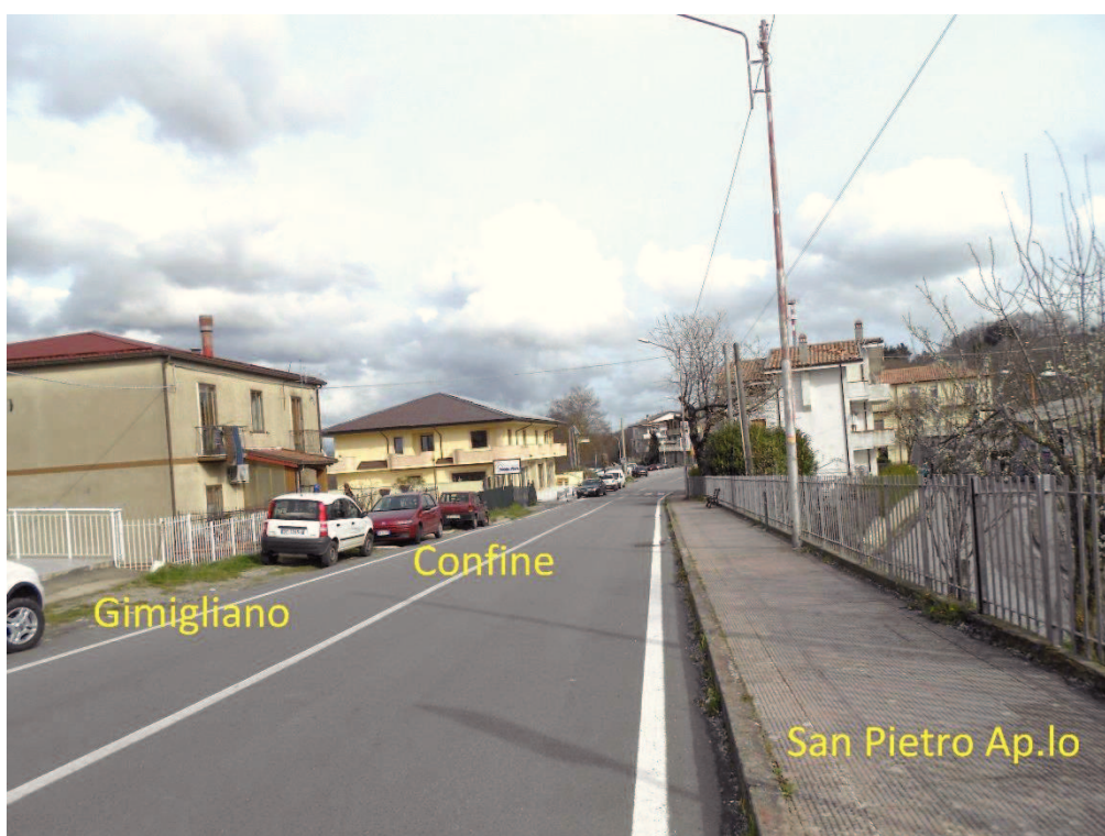
Figura 12 – Corso Vittorio Emanuele II, lato San Pietro Ap. Io, prima dell'ingresso al centro urbano