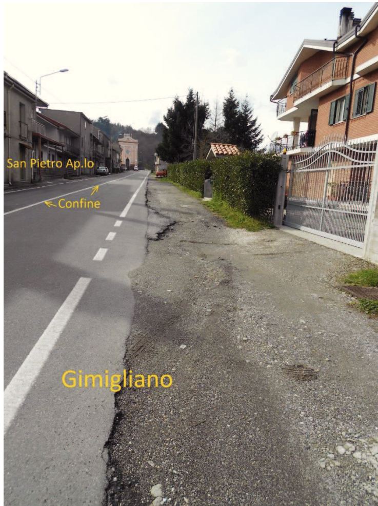
Figura 9 – Corso Vittorio Emanuele II, lato Gimigliano senza nessun marciapiede