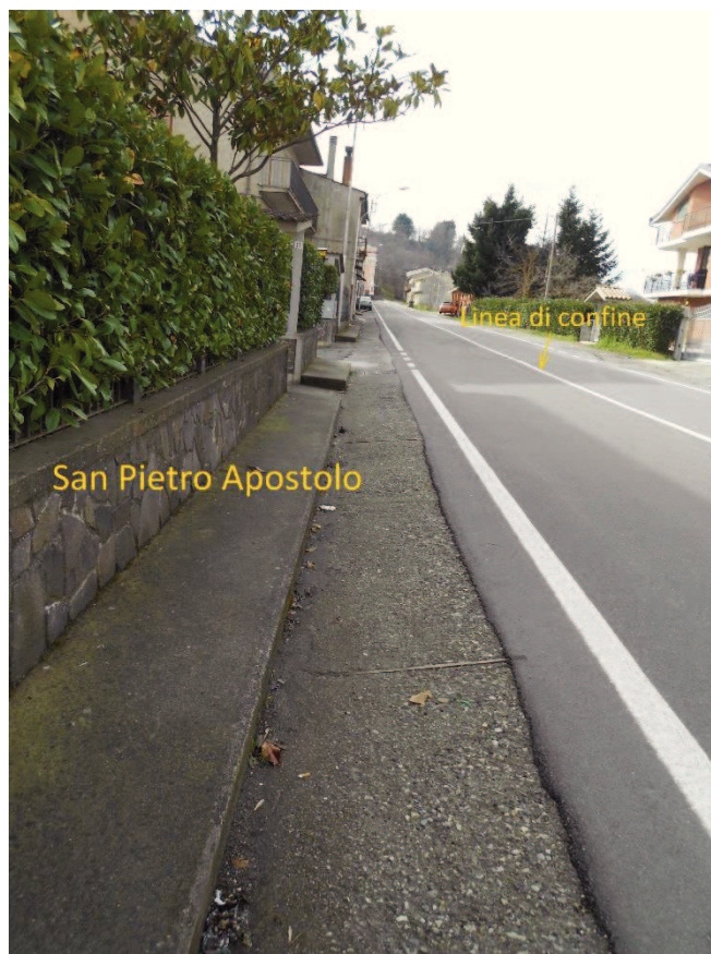
Figura 8 - Corso Vittorio Emanuele II, lato San Pietro Apostolo