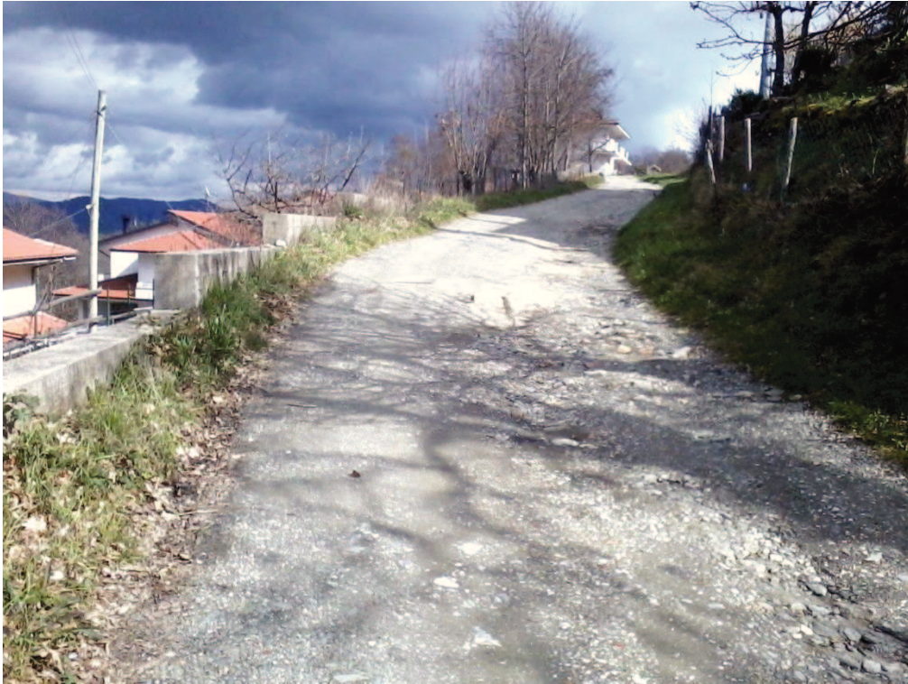
Figura 13 – Lottizzazione di contrada Colla, strada interna tra i lotti