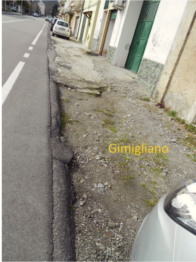
Figura 5 – Corso Vittorio Emanuele II, lato Gimigliano senza marciapiede