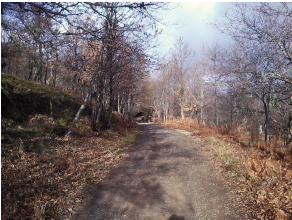
Figura 20 – Strada interpoderaie delle Manche