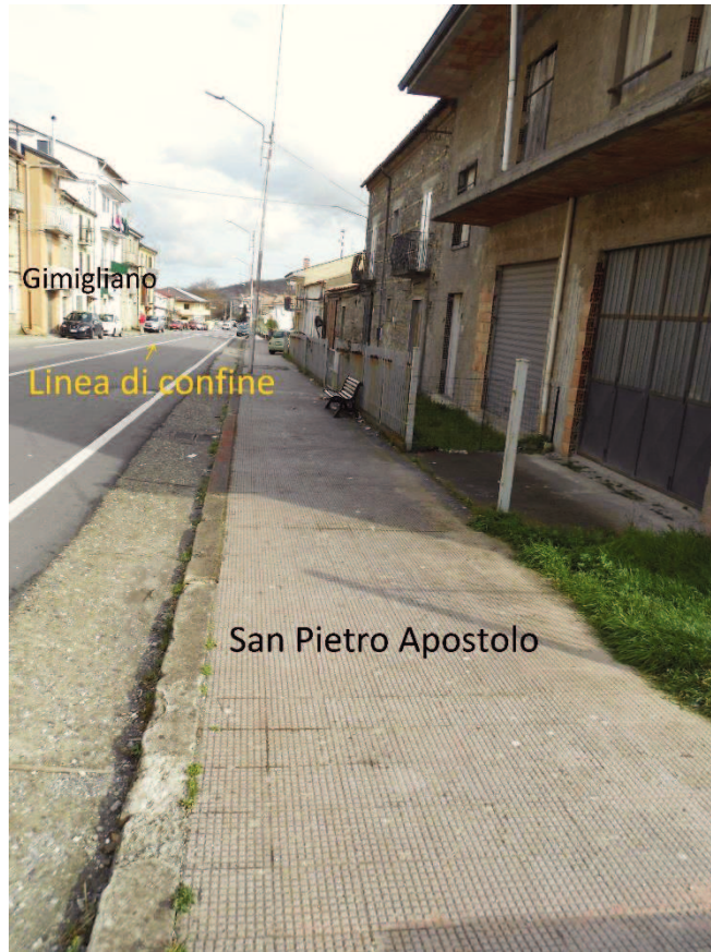
Figura 7 – Corso Vittorio Emanuele II, lato San Pietro Apostolo