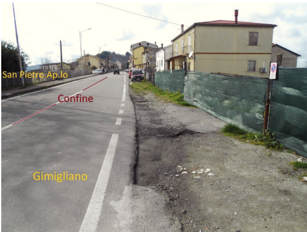
Figura 2 – Corso Vittorio Emanuele II, lato Gimigliano, senza alcun marciapiede