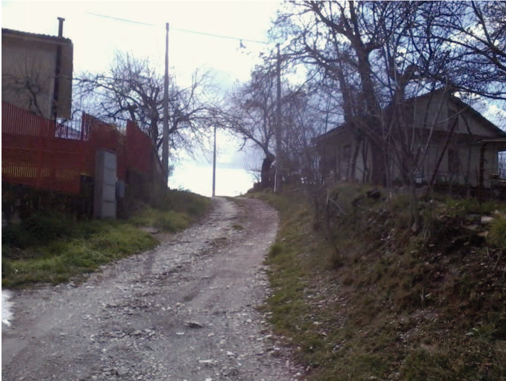
Figura 17 – Lottizzazione di contrada Colla, strada interna tra i lotti