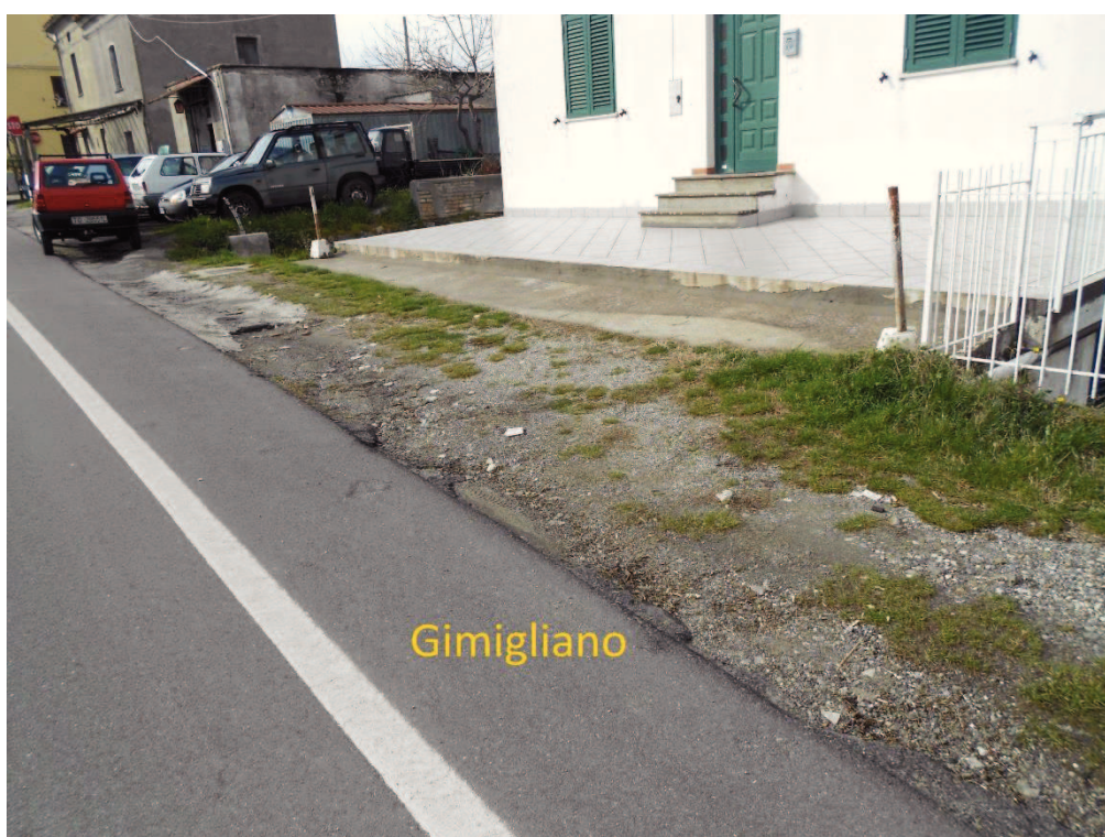
Figura 4 – Corso Vittorio Emanuele II, lato Gimigliano senza marciapiede