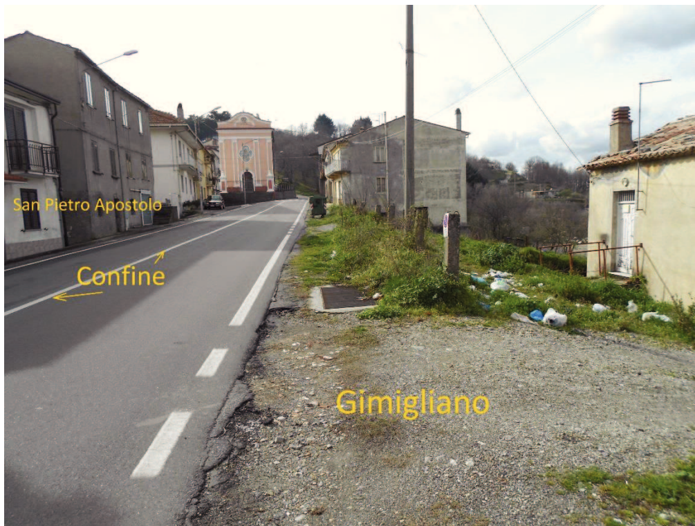
Figura 10 – Corso Vittorio Emanuele II, lato Gimigliano senza marciapiede