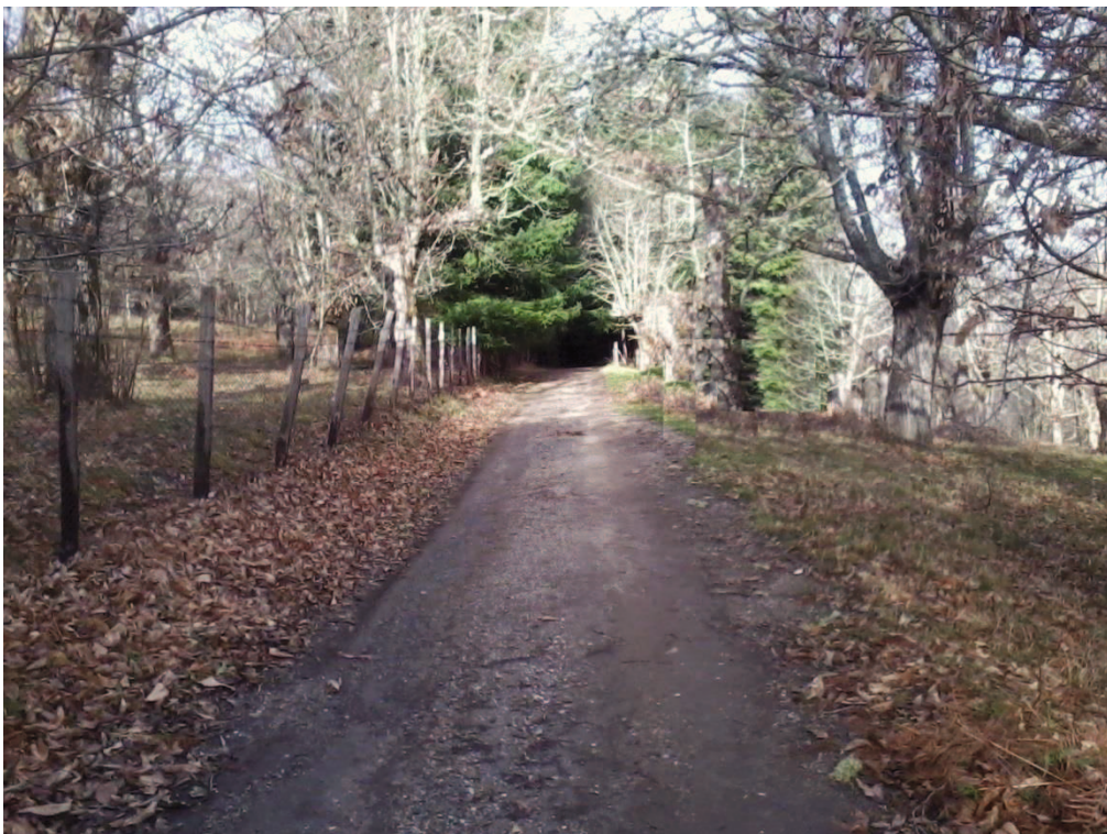
Figura 18 – Strada della Manche, individuata come possibile confine tra i due comuni