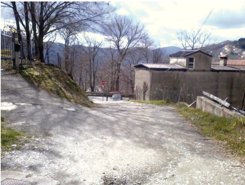
Figura 14 – Lottizzazione di contrada Colla, ingresso dalla SP 165/2