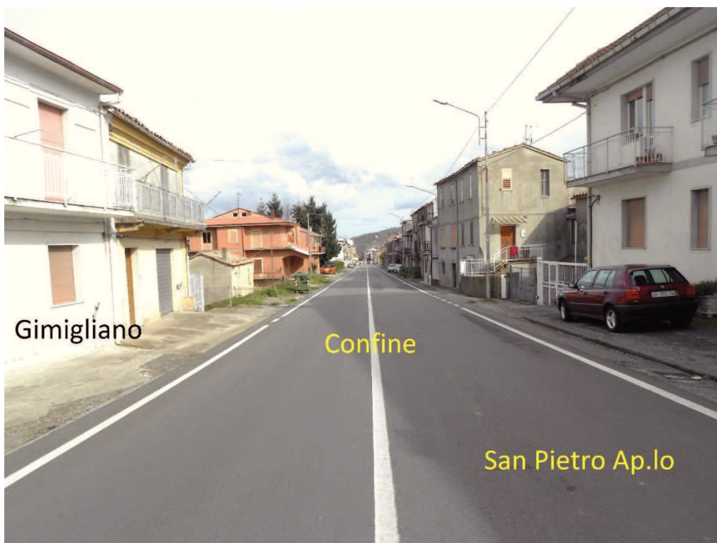
Figura 11 – Corso Vittorio Emanuele II, visto dalla Chesa